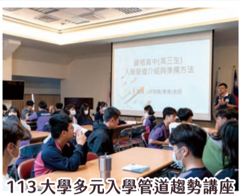
113大學多元入學管道趨勢講座