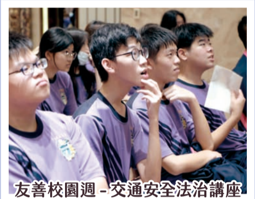
友善校園週 - 交通安全法治講座